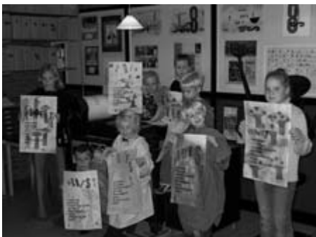
Een aantal van de kinderen van 4 t/m 12 jaar toont trots hun werk