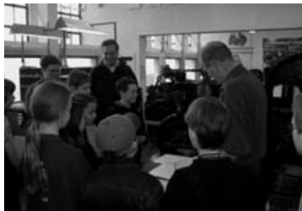
Bezoek aan het Grafisch Museum Groningen