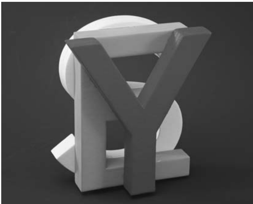
ja 2002, detail ruimtelijk wandobject 'yes you are the one', karton, stans, spuitbus, pag. 103