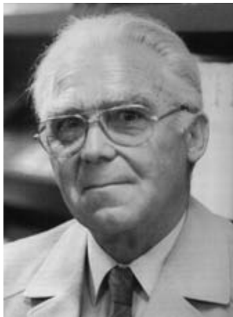
Max Caflisch omstreeks 1983.

Met Jost Hochuli behoort de in februari overleden Max Caflisch tot de meest bekende en gewaardeerde Zwitserse typografen. Caflisch begon zijn loopbaan in Basel, waar hij als ‘erster Akzidenzsetzer’ werkte voor Benno Schwabe & Co. Aan deze firma was toen de door hem hooglijk bewonderde Jan Tschichold als ontwerper verbonden. Schwabe was ook de uitgever van diens handboekje Typographische Gestaltung (1935), dat Caflisch als scholier gefascineerd had bestudeerd. Hij haalt in het onlangs verschenen Jan Tschichold: Revolutionär, Reformier oder Renegat? herinneringen op aan die jaren: ‘Mit Tschichold hatte ich so gut wie keinen Kontakt, man grüßte sich. Mit Sperberaugen besah ich mir die von Tschichold entworfenen, bei den Setzern liegenden Satzskizzen, auch die von ihm zwei- oder dreimal korrigierten Abzüge und schließlich die endgültigen Drucke’. Later zou