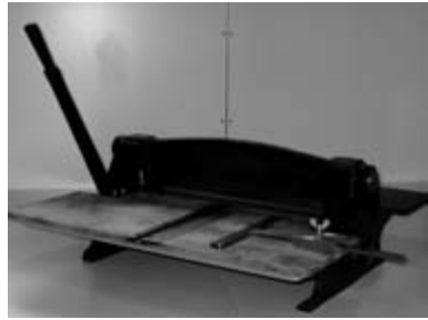
Handrilmachine zonder rilmessen