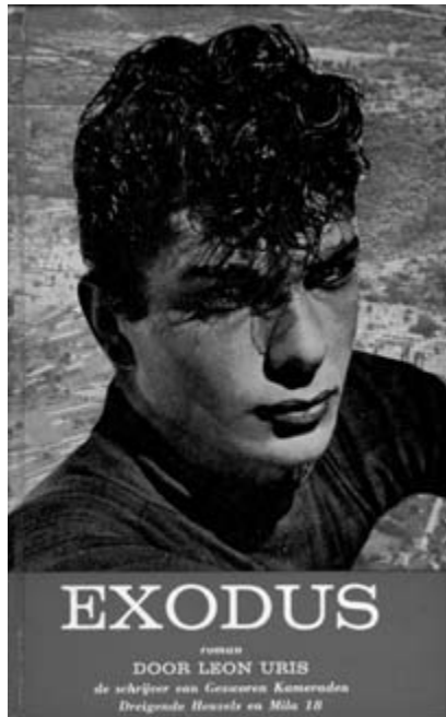
Roman van Leon Uris, 23e (goedkope) druk, 1963