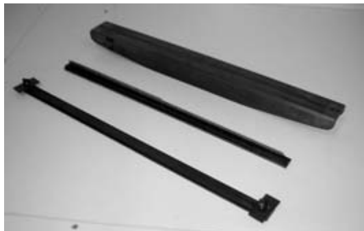
Perforatiemessen van de handrilmachine