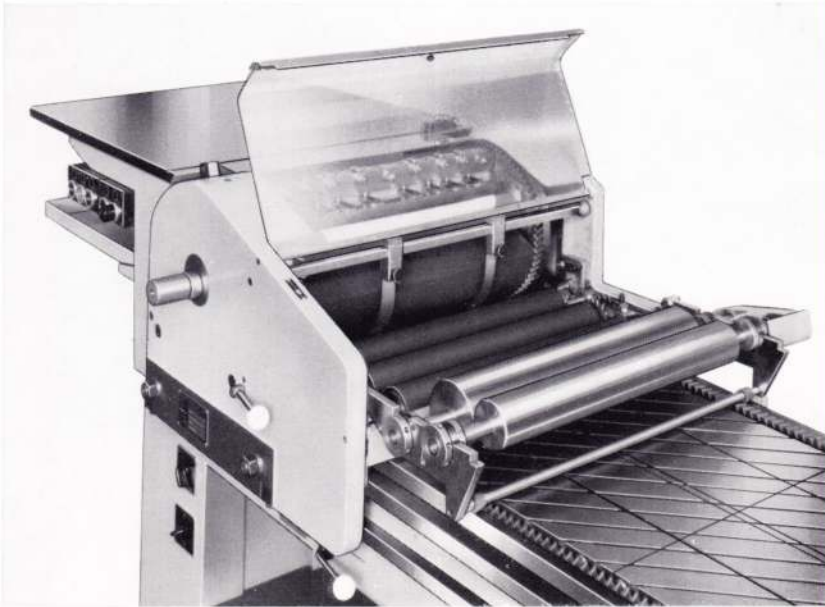
Farbwalzen und Farbwalzenstuhl auswechselbar, Reibwalzen abschwenkbar