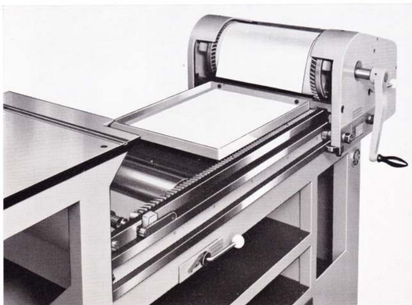
Druckzylinder am Druckende